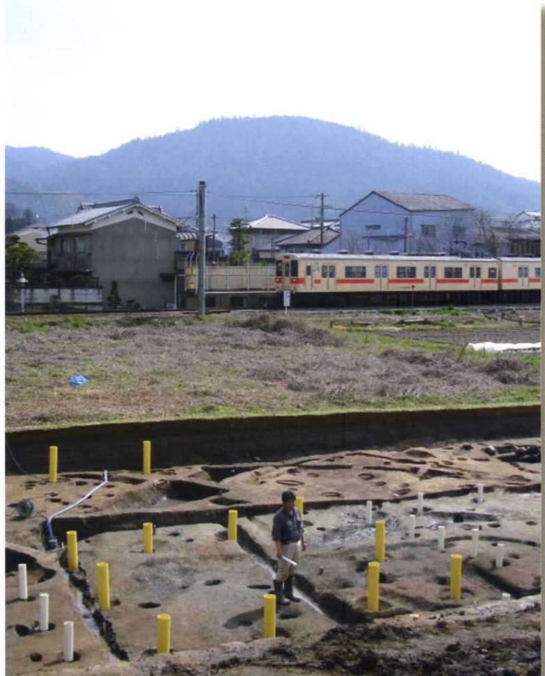
写真2 検出された建物遺構群（西より） 黄色い柱は建物の柱跡で白い柱は柵列の柱跡を示しています。

柱列C 昭和53年の調査時点で確認されている東西柱列で柱列Bの北端の柱穴から西へ7基の柱穴で構成されています。建物Bの南面柱列との間隔は約1.4 mで今回の調査では西