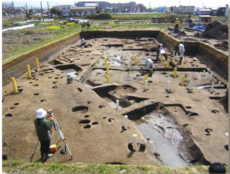
写真1 調査風景（北より）

また、調査区の北半もやはり北側の谷部へと地山が徐々に落ち込んでいますが、この部分は整地土によって平坦面が造成されており、下層遺構はこの整地土の上面において検出されています。